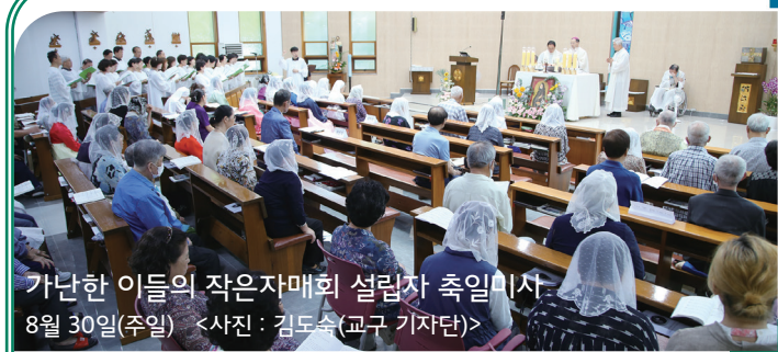
가난한 이들의 작은자매회 설립자 축일미사 8월 30일(주일)