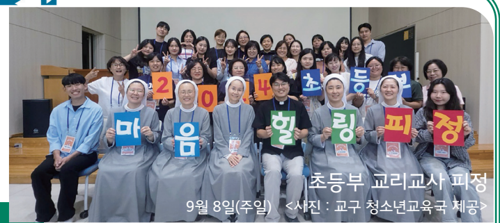
초등부 교리교사 피정 9월 8일(주일)