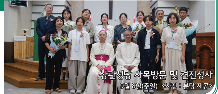
상관성당 사목방문 및 견진성사 9월 8일(주일)