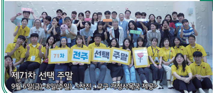
제7차 선택 주말 9월 6일(금)~8일(주일)