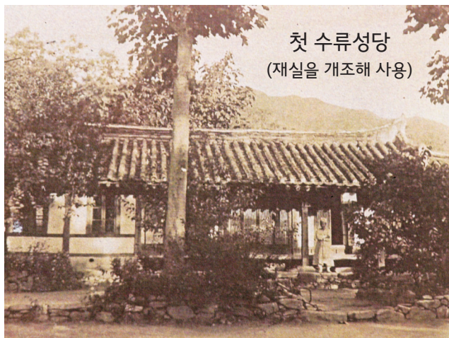
첫 수류성당 (재실을 개조해 사용)

1950년 한국전쟁 중 수류성당은 큰 시련을 겪었다. 수류성당으로 피신한 김현배 교구장과 신부·수녀들이 인민군에 잡혀가고, 50여 명 이상의 신자들이 순교했을 뿐 아니라 유서 깊은 성당도 인민군에 의해 소실되고 말았다. 그러나 이곳으로 옮긴 교구청 문서는 항아리에 담아 땅에 묻었기에 보존할 수 있었다. 이후 1959년 성당·사제관·수녀원을 다시 건립했다. 2021년에 전라북도 기념물 “수류성당지”로 지정되었다.