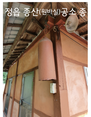
정읍 종산(원바실)공소 종

소개 : 1890년경 설립된 공소이다. 숲을 끊거나 소금 장사로 생계를 유지하며 신앙을 지켰지만, 6.25 때는 많은 이들이 희생되는 아픔을 겪은 곳이기도 하다. 아름다운 소리를 내는 종이 달려있고, 네덜란드에서 들여온 성모상이 세워져 있다.