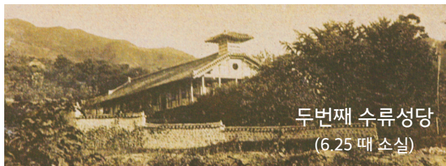
두번째 수류성당 (6.25 때 소실)