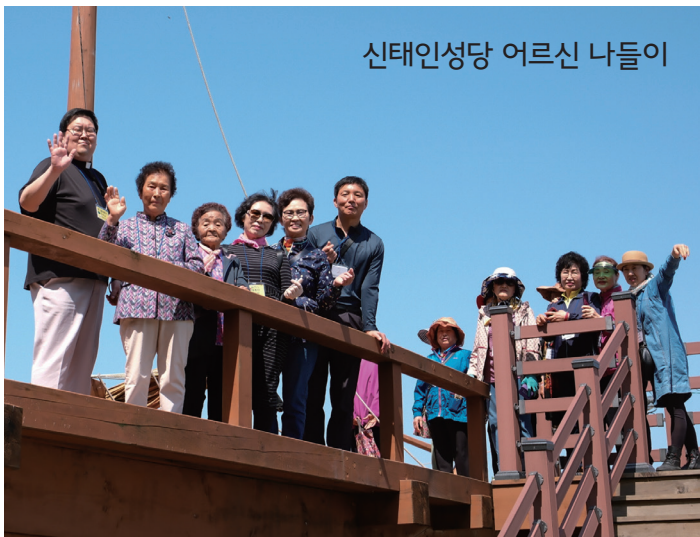
신태인성당 어른신 나들이