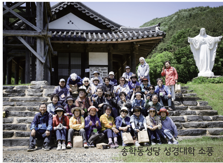
송학동성당 성경대학 소풍