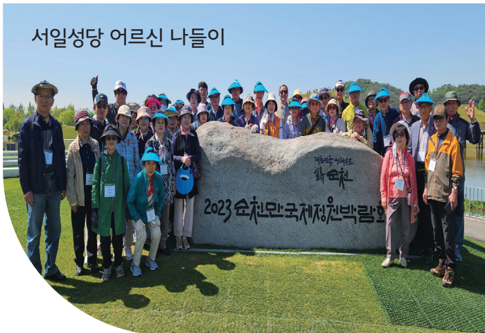
서일성당 어른신 나들이