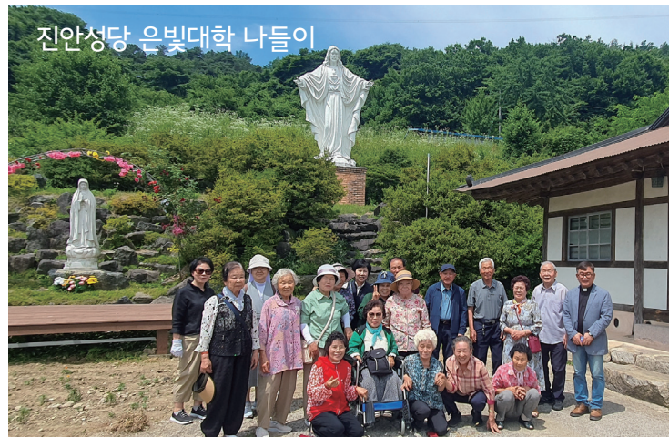
진안성당 은빛대학 나들이