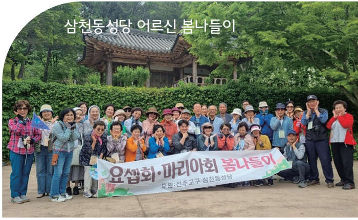
삼천동성당 어른신 봄나들이