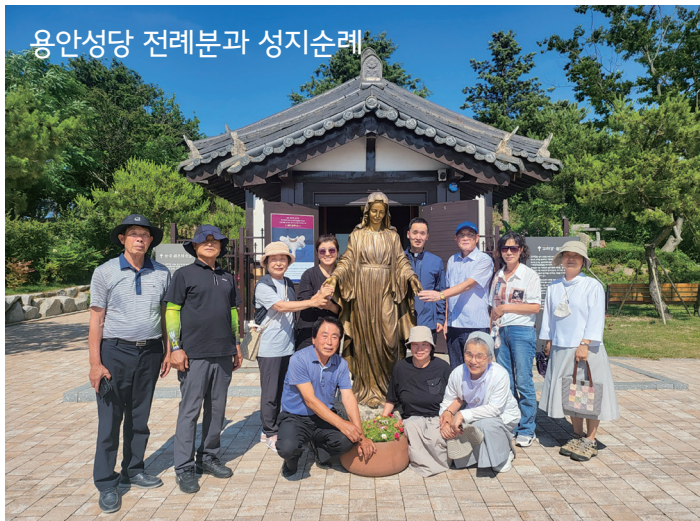
용안성당 전례분과 성지순례