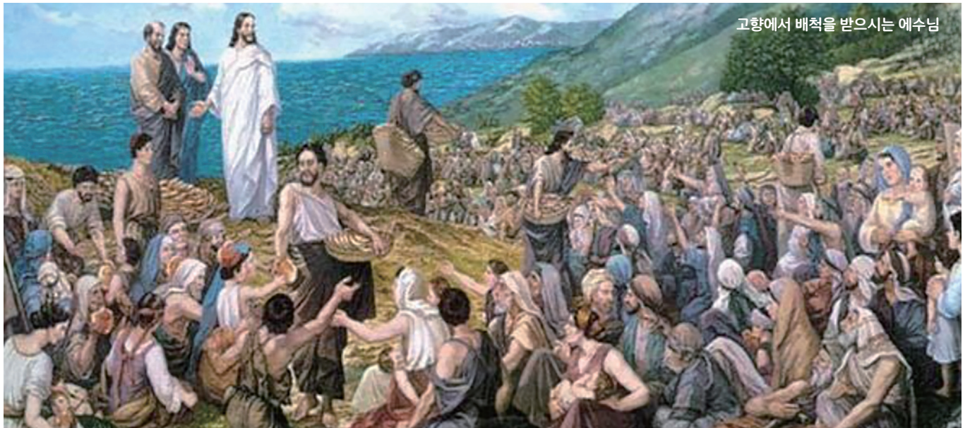
고향에서 배척을 받으시는 예수님

집에서 가족들이 바라보는 것과 다르다는 말입니다. 너무나 잘 알고 가깝다는 이유로, 내가 먼저 가족들에게 다가가고 배려하기보다는 가족들이 먼저 나에게