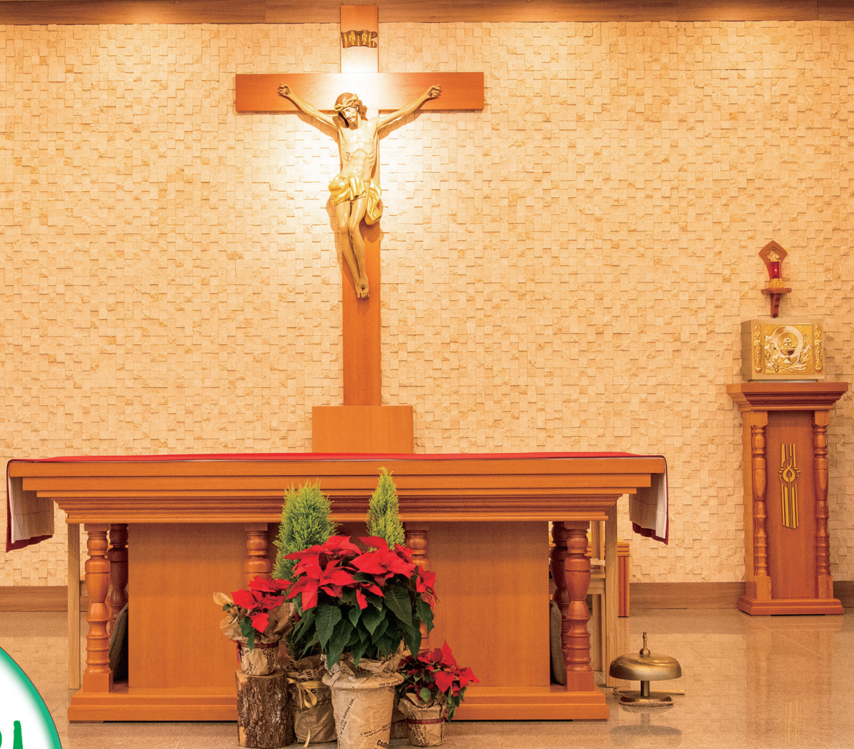
제대 사진 : 호성만수성당(1지구)