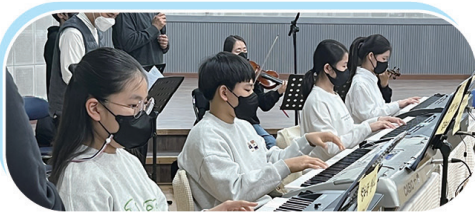
제1기 주일학교 반주자 양성 교육 파견 미사