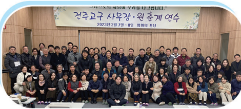
전주교구 사무장·원 춘계 연수