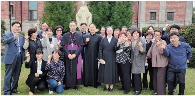
▲ 함열성당 사목방문 10월 16일(주일) 함열