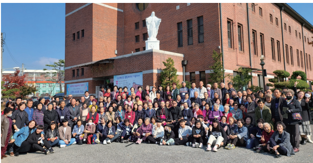
▲ 상삼례성당 본당설립 30주년 기념 미사 10월 30일(주일) 상삼례 <4>