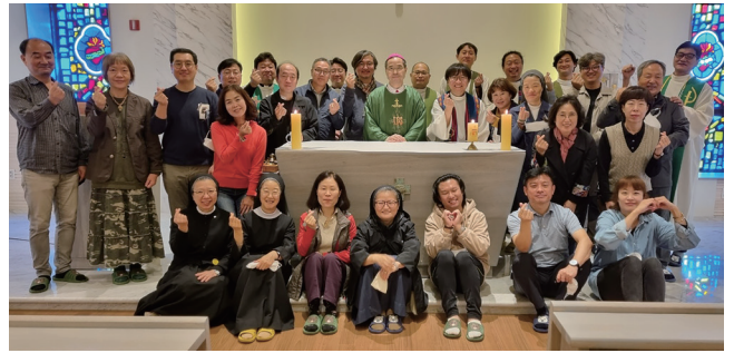
▲ 2022년 전국 정의평화 활동가 연수 10월 20일(목)~22일(토) 평화의 전당