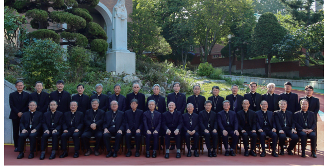
▲ 주교회의 추계 정기총회 10월 10일(월)~14일(금) CBCK