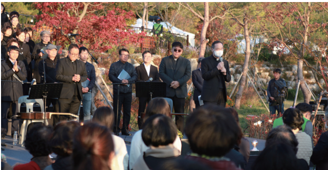
▲ 초남이성지의 날 봉사자·후원자를 위한 음악회 10월 23일(주일) 초남이성지