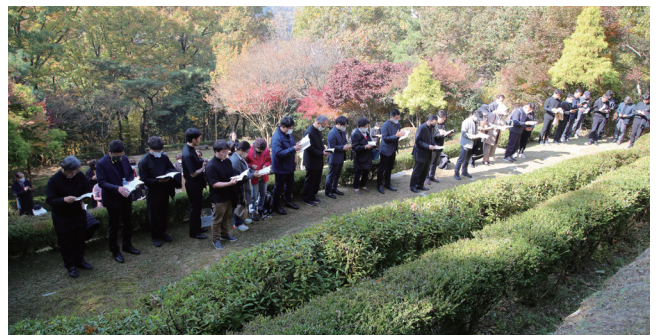
▲ 위령의 날 합동 위령 미사 11월 2일(수) 치명자산성지