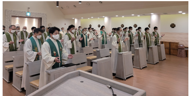
▲ 교구사제 3차 연례 피정 10월 24일(월)~28일(금) 평화의 전당