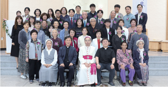
▲ 송천동성당 사목방문 및 견진성사 10월 9일(주일) 송천동