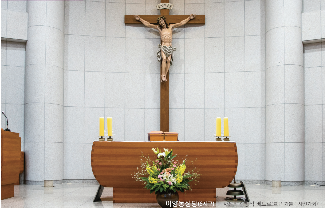
어양동성당(6지구) | 사진 : 김장식 베드로(교구 가톨릭사진가회)

- 2022년 교구장 사목교서 - “끊임없이 기도하십시오.”(1테살 5,17)