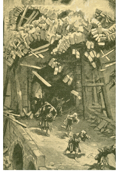
실로암 탑 (James Tissot 作, 1896-97)

또한 이 말씀은 “나는 있는 그대로 너희를 바라볼 수 있는 나다.”라는 말로 바꿔 생각해볼 수 있을 것입니다. 있는 그대로 우리를 사랑해주시는 하느님의 시선, 이 시선을 우리도 닮을 수 있어야 합니다.