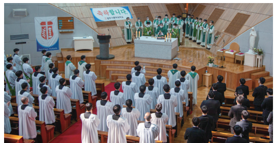
광주가톨릭대학교 직수여식 2월 27일(주일) 광주가대