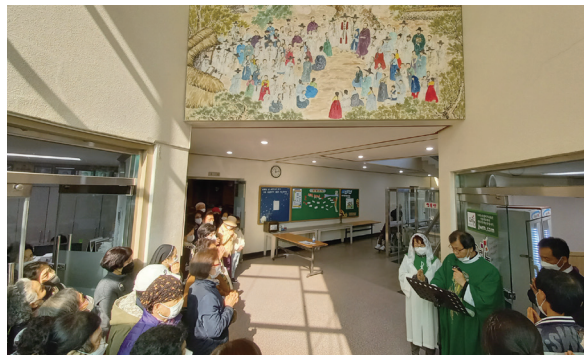
금암성당 103위 성인화 축복식