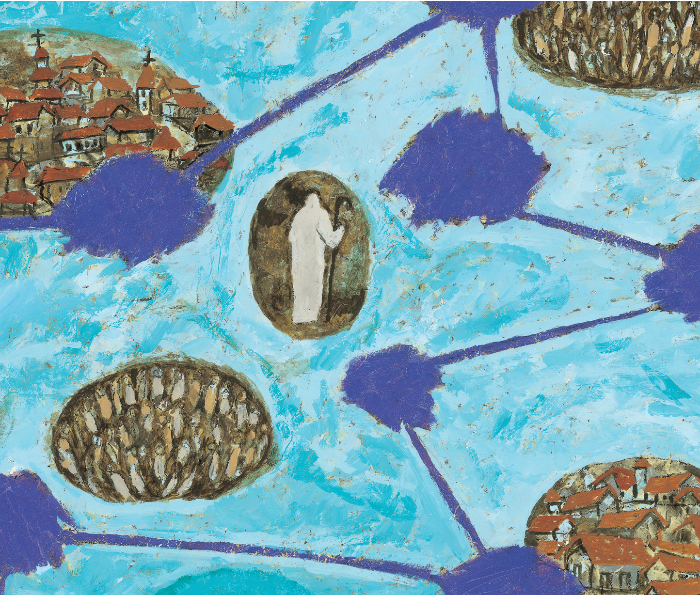
그림 : 정미연 소화데레사

2021년 교구장 사목교서 - “너희는 나를 기억하여 이를 행하여라.”(루카 22,19)