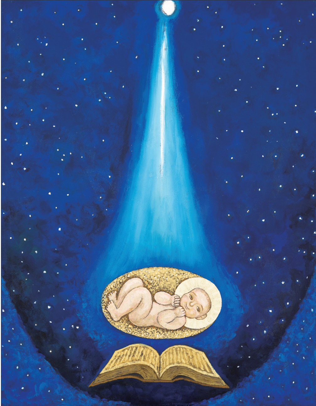
그림 : 정미연 소화데레사

2021년 교구장 사목교서 - “너희는 나를 기억하여 이를 행하여라.”(루카 22,19)