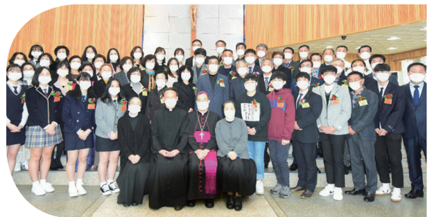
▲ 영등동성당 사목방문 및 견진