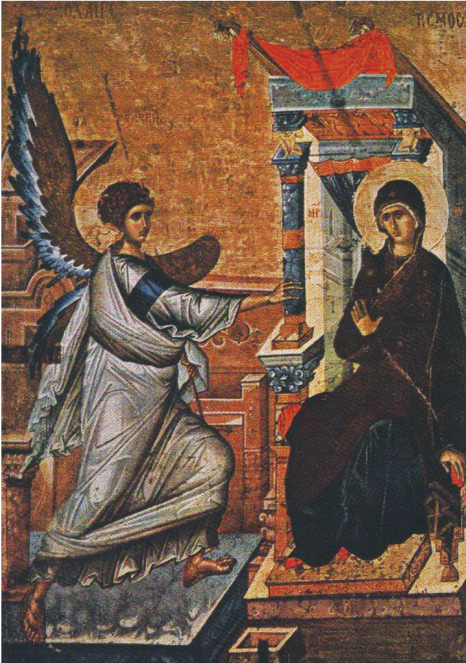
“은총이 가득한 이여, 기뻐하여라. 주님께서 나와 함께 계신다.” (비잔틴 이콘, 14세기 / 스키펴데 박물관)

대림 초 4개 모두에 불이 뎡겨졌습니다. 빛이 밝아진 만큼 우리의 마음도 맑고 밝아지길 희망합니다.