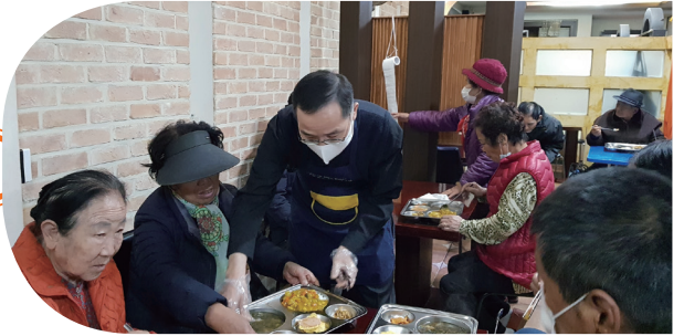
▲ 무료 급식소 요셉식탁 배식 봉사