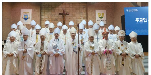
▲ 제주교구 제5대 교구장 착좌식