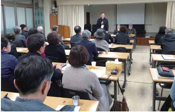
쌍교동성당 사목회 워크샵