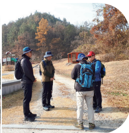
▲ 새 사제와 함께하는 도보순례