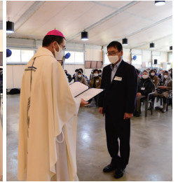
▲ 성지순례 축복장 수여식 11월 10일(화) 치명자산 장막성전