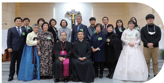
▲ 칠보성당 사목방문 및 견진