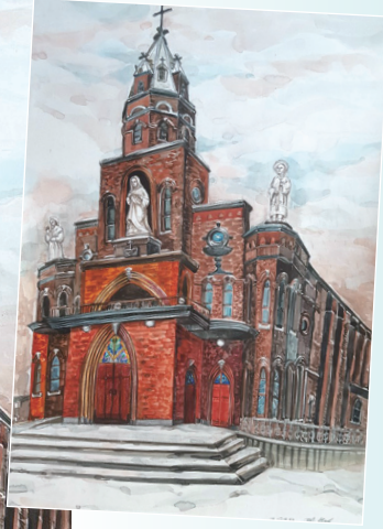
† 중앙성당 (1지구)