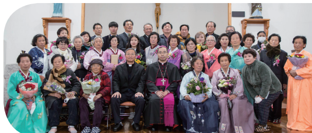
11월 28일(주일)