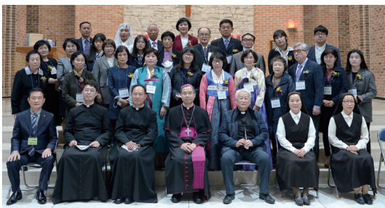
▲ 서신동성당 견진성사 10월 17일(토)