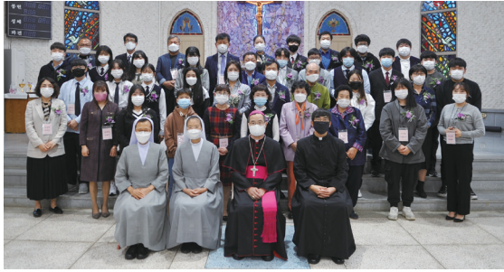
▲ 삼례성당 견진성사 10월 11일(주일)