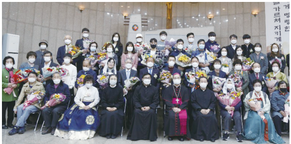
▲ 평화동성당 견진성사 10월 25일(주일)