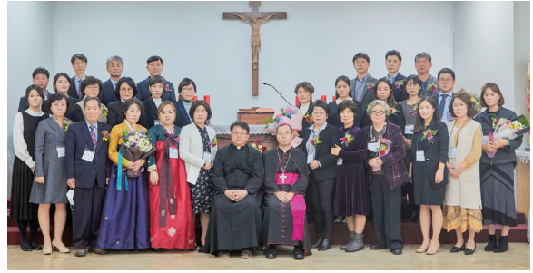
▲ 서곡성당 견진성사 11월 1일(주일)