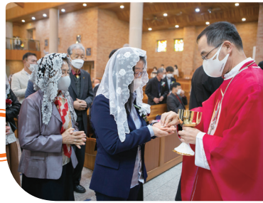
◀ 삼천동성당 견진성사 10월 18일(주일)