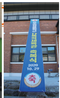
▲ 해성중학교 다목적체육관 축복식 10월 29일(목)