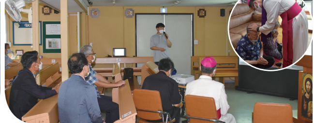
▲ 중산성당 사목방문 8월 23일(주일) 중산