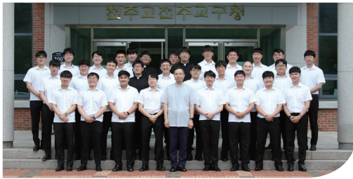
▲ 신학생 개학인사 8월 14일(금) 교구청