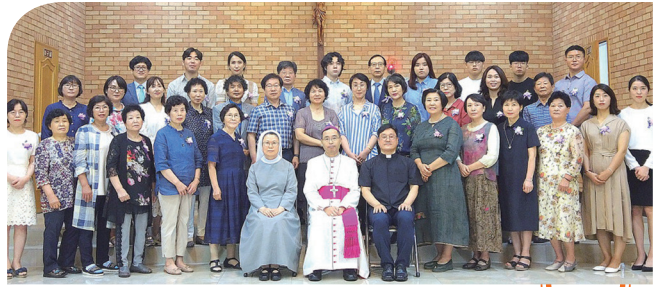
▲ 아중성당 사목방문 및 견진 8월 9일(주일) 아중