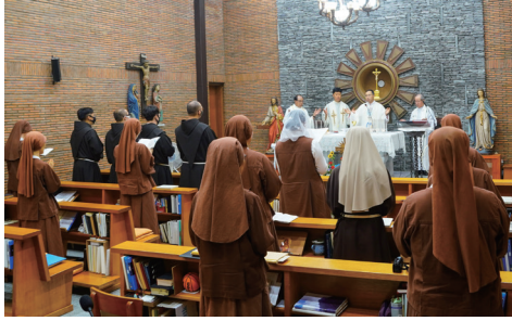
▲ 성클라라대축일 미사 8월 11일(화) 성클라라수도원