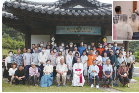
▲ 성모승천대축일 미사 8월 15일(토) 천호