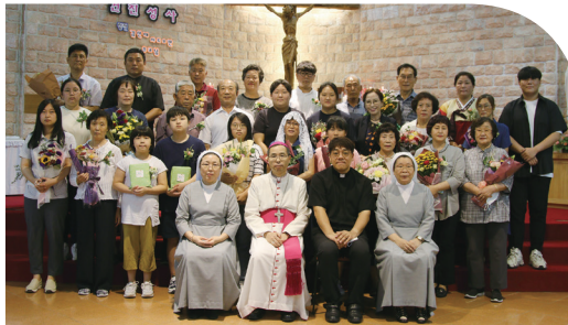
▼ 만경성당 견진 9월 6일(주일) 만경