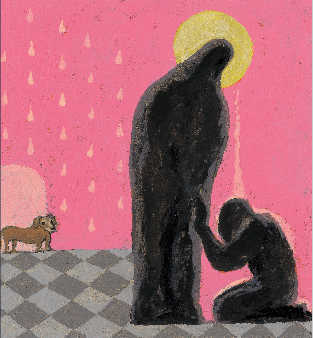
그림 : 정미연 소화테레사

2020년 교구장 사목교서 - “내가 너희에게 명령한 모든 것을 가르쳐 지키게 하여라.”(마태 28,20)