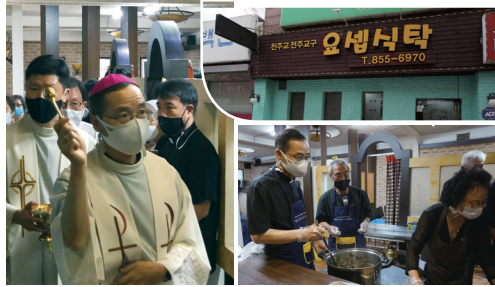
▲ 요셉식탁 개소식 9월 1일(화) 익산 요셉식탁