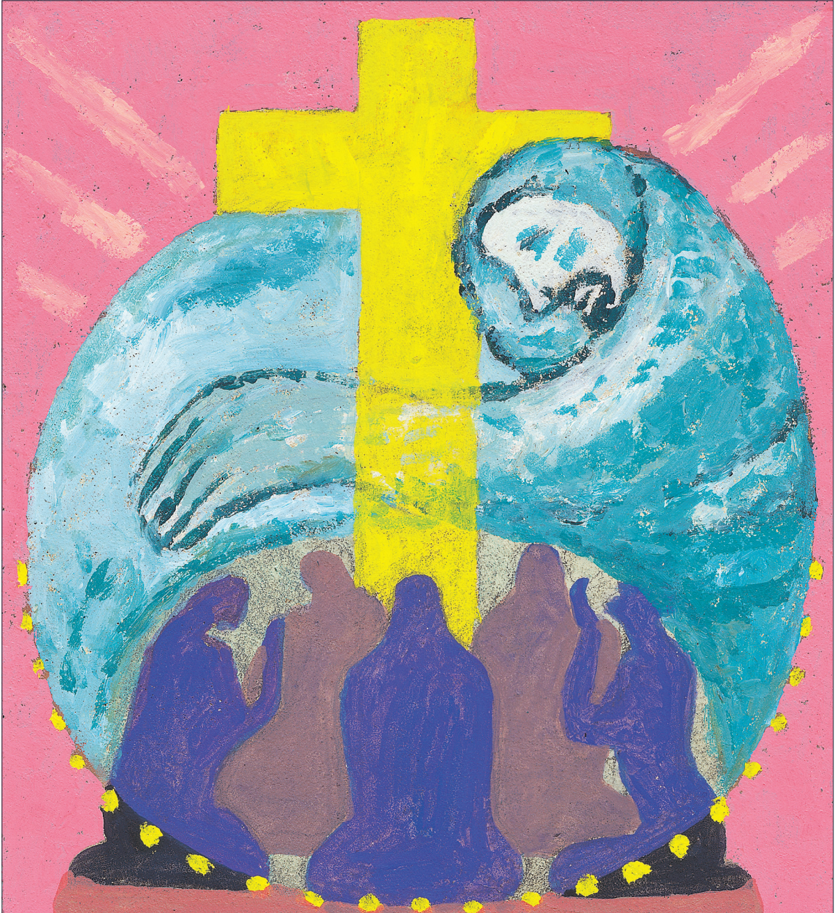
그림 : 정미연 소화테레사

2020년 교구장 사목교서 - “내가 너희에게 명령한 모든 것을 가르쳐 지키게 하여라.”(마태 28,20)