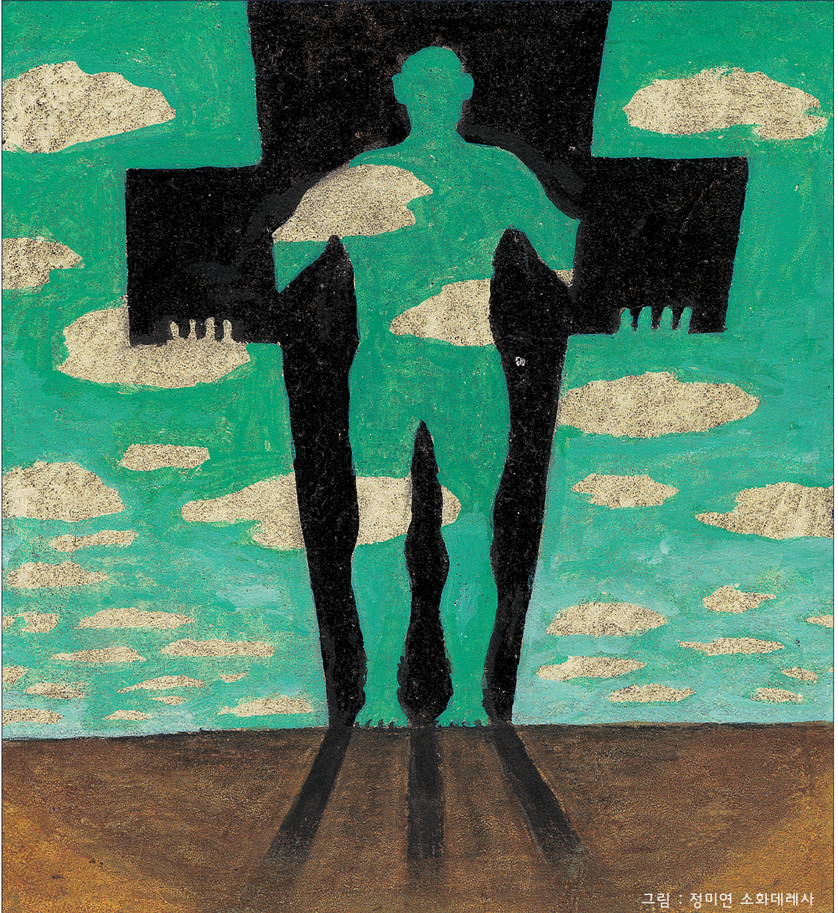
그림 : 정미연 소화테레사

2020년 교구장 사목교서 - “내가 너희에게 명령한 모든 것을 가르쳐 지키게 하여라.”(마태 28,20)