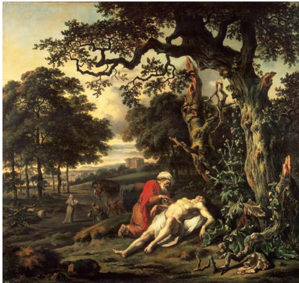
착한 사마리아인의 비유(Wynants Jan, 1670)

도움을 필요로 하는 사람들을 사랑하십니다. 바로 그러한 사람들에게 사랑을 실천하는 것이 하느님께 사랑을 실천한 것이 됩니다. 그러나 그러한 사람들에게 사랑을 실천하지 않은 것은 하느님께도 사랑을 실천하지 않은 것입니다.(마태 25,31-45 참조)