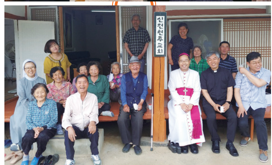
▶ 임실 사목방문 및 신전공소 방문 6월 7일(주일) 오전 10시 30분 임실