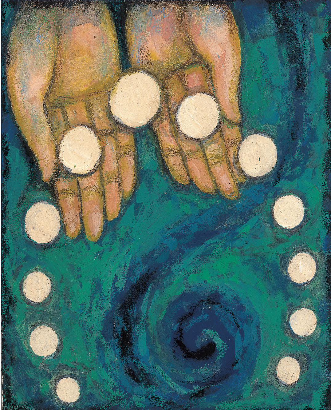
그림 : 정미연 소화테레사

2020년 교구장 사목교서 - “내가 너희에게 명령한 모든 것을 가르쳐 지키게 하여라.”(마태 28,20)