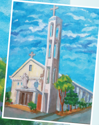
† 대야성당 (5지구)