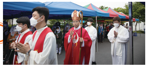
◀ 팔복동 사목방문 및 견진 5월 24일(주일) 오전 10시 30분 팔복동