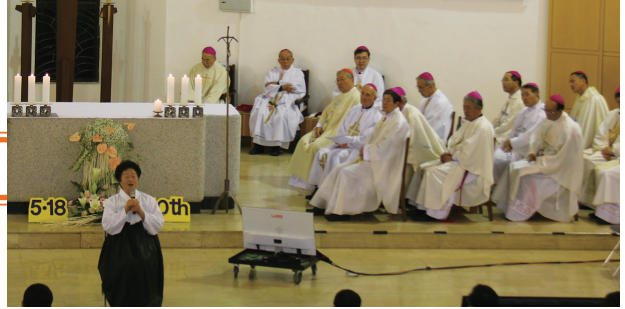
▲ 5·18 민주화운동 40주년 기념 미사 '5·18 민주화운동 40주년'을 기념하는 미사가 5월 17일(주일) 광주대교구 주교좌 임동성당에서 김희중 대주교(광주대교구장)의 주례로 봉헌되었다. 이날 미사에는 김선태 주교(전주교구장)를 비롯하여 각 교구 주교와 사제, 유가족 등이 참여하여 희생자들을 추모했다. <홍보국 정리>