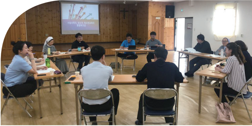
▲ 교구 성소국, 가정사목국, 청소년교육국 워크숍 모습

교구 예비신학생과 신학생들이 줄어가고 있습니다. 청소년과 젊은이들이 교회에서 점점 멀어져 가고 있으니 어쩔 수 없는 일인지도 모릅니다. 가정교회에서 가족들이 모여 기도하는 소리가 줄어들고 있습니다. 그러니 본당 미사에 청소년들이 점점 보이지 않는 것은 당연한지도 모릅니다. 이렇게 우리 교구의 복음화율은 떨어지고 있으며, 냉담자들은 늘어나고 있습니다. 이러한 현상은 2018년 교구장 사목교서에서 지적했듯이 경제적 성공을 우선시하는 가치관 안에서 신앙인의 본질적인 사명과 책무를 외면하고, 신앙이 삶의 본질적인 기준과 목적이 아니라 부분적인 것으로 여기기 때문일 것입니다.(2018년 전주교구 교구장 사목교서 4항) 이러한 현상을 물질 만능주의의 사회에서 어쩔 수 없는 것이라고 순응하기에는 주님이 주신 “너희는 가서 모든 민족들을 제자로 삼아, 아버지와 아들과 성령의 이름으로 세례를 주고, 내가 너희에게 명령한 모든 것을 가르쳐 지키게 하여라.”(마태 28, 19-20)는 명령이 너무도 중대합니다.