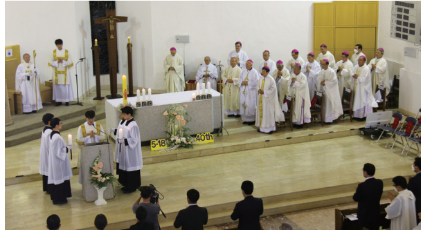
글 : 홍보국 정리

‘5·18 민주화운동 40주년’을 기념하는 미사가 5월 17일(주일) 광주대교구 주교좌 임동성당에서 김희중 대주교(광주대교구장)의 주례로 봉헌되었다. 이날 미사에는 염수정 추기경(서울대교구장)과 알프레드 슈에레브 대주교(주한 교황대사)를 비롯하여 각 교구 주교와 사제, 유가족 등이 함께하며 희생자들을 추모했다.