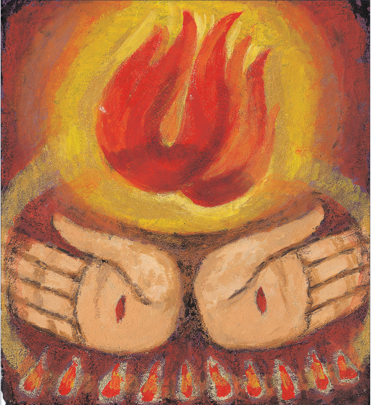
그림 : 정미연 소화테레사

2020년 교구장 사목교서 - “내가 너희에게 명령한 모든 것을 가르쳐 지키게 하여라.”(마태 28,20)