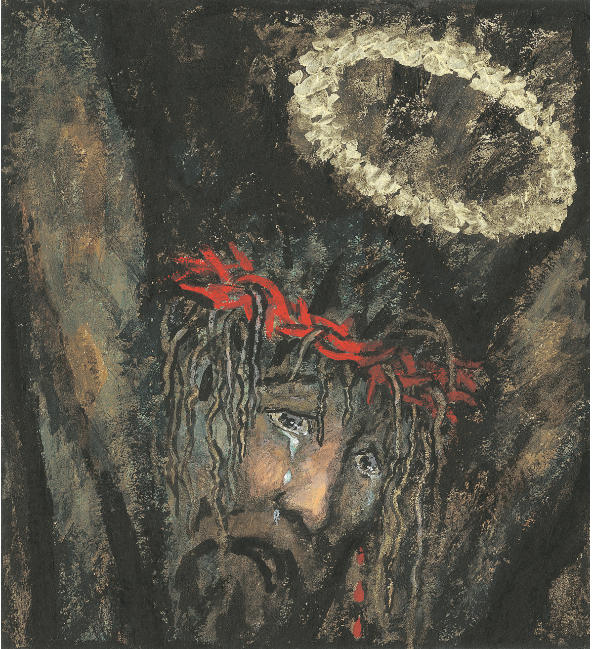
그림 : 정미연 소화데레사

2020년 교구장 사목교서 - “내가 너희에게 명령한 모든 것을 가르쳐 지키게 하여라.”(마태 28,20)