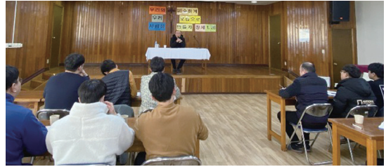
▲ 신학생 동계 연수