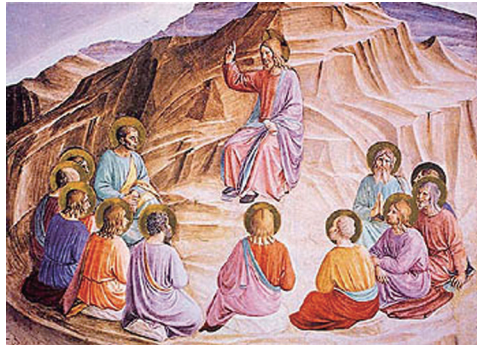
'산상설교' 프라 안젤리코작(1400-1455년경)

신학교에서 교회법을 배울 때, 교회법 교수 신부님께서 많은 교회법의 조항들을 가르쳐 주신 뒤, 이 모든 법들이 지향하는 궁극적인 목적에 대해 교회법의 마지막 조항을 인용하여 이