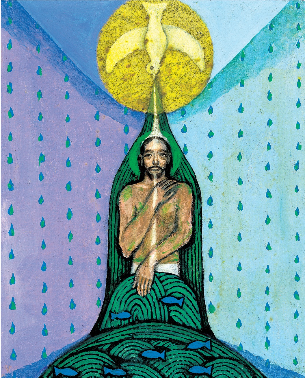
그림 : 정미연 소화데레사

2020년 교구장 사목교서 - “내가 너희에게 명령한 모든 것을 가르쳐 지키게 하여라.”(마태 28,20)