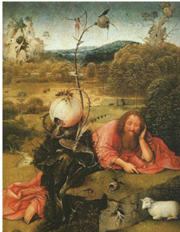
▲ 광야의 성 요한 세례자 (히에로니무스 보스 작, 1489)

오늘 세례자 요한은 예수님을 ‘하느님의 어린양’이라고 불렀으며, 실제로 예수님의 삶 자체가 하느님의 어린양의 삶이었음을 우리는 십자가상 제사를 통해 알 수 있습니다. 어리숙해 보이고 미련해 보이며, 실패한 것 같은 예수님의 삶이 결국 승리했음을 십자가와 부활 사건이 우리에게