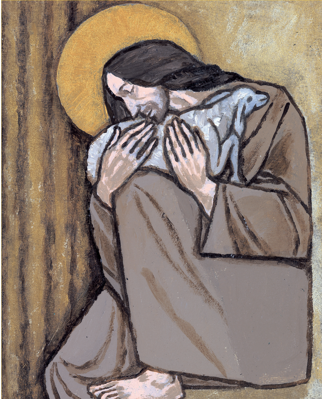
그림 : 경미연 소화데레사

2019년 교구장 사목교서 - “믿음은 들음에서 옵니다.”(로마 10,17)