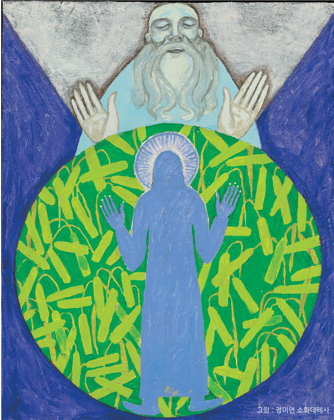
그림 : 정미연 소화데레사

2018년 교구장 사목교서 - “여러분 자신이 변화되게 하십시오.”(로마2,2)