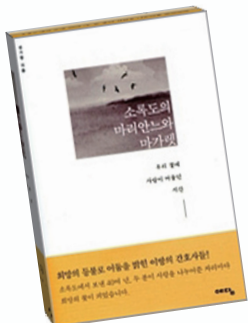
성기영 / 예담출판

무엇이 삶을 가치 있게 하는가. 먼 나라에서 온 간호사 마리안스와 마가렛이 소록도에서 보낸 43년동안 사랑을 실천하며 헌신해온 이야기를 중심으로 두 분의 일생을 진솔하게 풀어낸, 우리네 삶의 역사가 고스란히 담긴 소중한 자료이다.