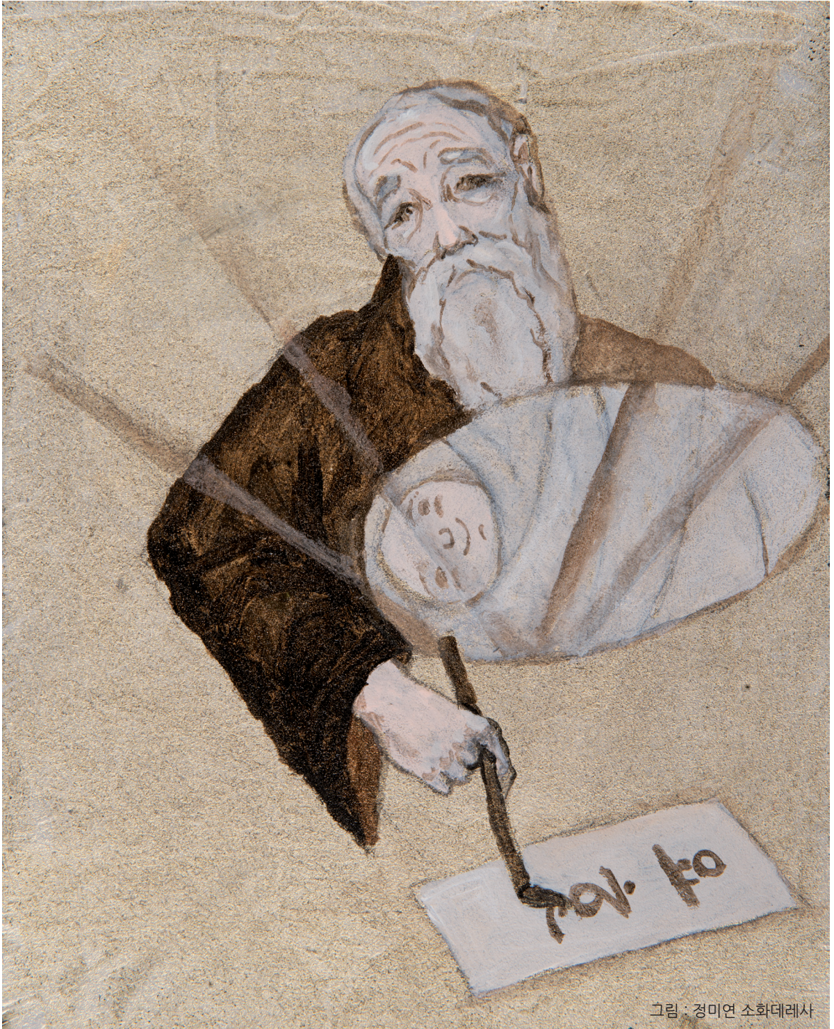
그림 : 정미연 소화테레사

2018년 교구장 사목교서 - “여러분 자신이 변화되게 하십시오.”(로마2,2)