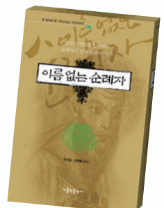
역자: 최익철, 강태웅 / 가톨릭출판

‘예수 기도’를 씬 없이 실천하는 한 이름 없는 순례자의 순례 여정이 담겨 있다. 늘 쉬지 않고 기도하는 순례자의 모습과 그가 순례의 여정에서 겪는 갖가지 사건과 고난들, 그 길에서 만나는 영성가들과의 대화는 독자에게 큰 감동과 영적 깨달음을 전할 것이다.