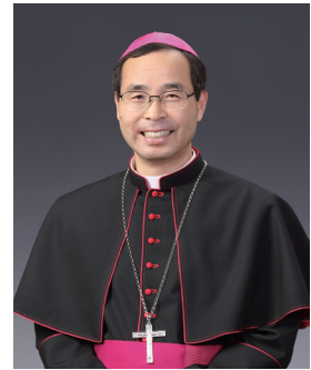
김선태 사도요한 주교 (전주교구장)

그러나 “예수님께서 사랑하신 다른 제자”는 직접적인 증거 없이 믿었습니다. 그는 예수님의 말씀을 믿었습니다. 특히 예수님께서 선포하셨던 하느님 아버지를 믿었습니다. 모든 것을 손에 쥐고 계신 하느님의 권능을 믿었던 것입니다. 그 하느님께서 당신께 충실