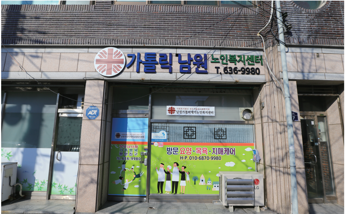
남원가톨릭재가노인복지센터 | 일상 생활을 혼자 수행할 수 없는 어르신들을 위해 방문요양 및 방문목욕 장기요양 생활시설. / 문의 : 063)636-9980