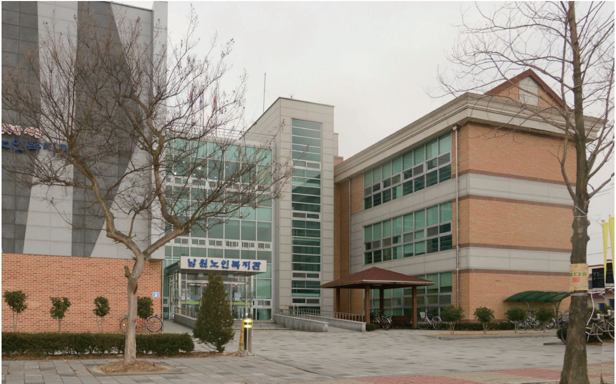
남원시노인복지관 | 어르신들의 삶의 질 향상을 위한 지역적 연계를 통해 문화·의료·상담 및 일자리 창출 사업 등을 하고 있다. / 문의:063)625-9988

2018년 교구장 사목교서 - “여러분 자신이 변화되게 하십시오.”(로마2,2)