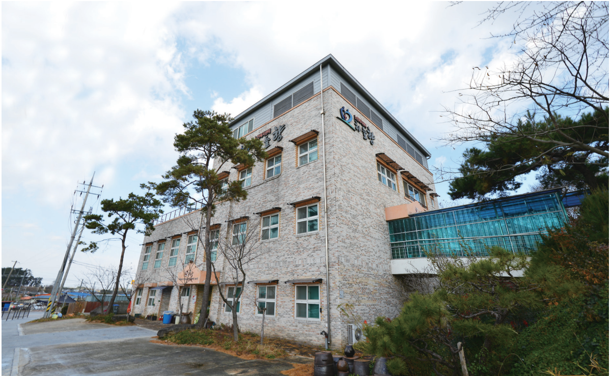
하늘향노인복지센터 | 주·야간보호(30명 정원) 및 노인요양공동생활가정(9명 정원), 재가 어르신들의 주간 돌봄과 방문요양 서비스를 제공하고 있는 노인복지센터 / 문의:063)571-9009

2018년 교구장 사목교서 - “여러분 자신이 변화되게 하십시오.”(로마2,2)