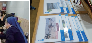
양성 프로그램 (주 1회 7주 과정)

에 숨어 있는 하나님의 사랑과 손 다. 또한 렌즈를 통해 바라본 사물 시가 되고, 기도가 됩니다.