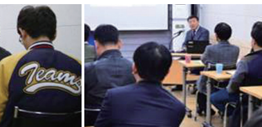
기록, 기념사진, 영정사진 (주 1회 8주 과정)