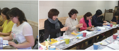
프로그램 (주 1회 10주 과정)

아름다운 모습을 되찾는 기쁨과 하나님을 더욱 깊이 참되게 알 수 있게 이끌어주는 프로그램.