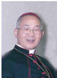
이병호 빈첸시오 주교 (전주교구장)

1. “(...) 마음에 평안이 없으니 누가 조금만 건드려도 바로 폭발할 듯 날카로워져갔습니다. 그런 상태로 창세기 연수 이튿날을 맞았습니다. 밤에 성사가 있을 거라는 안내를 받았습니다. 그 날 오전 갈래 모임에서도 나왔지만 성사는 늘 제게 긴장되고 어려운 일이었습니다. 하느님께 제 죄를 고백하는 건데 자꾸 신부님이 사람으로 보이고 의식이 되어서 제 말을 제가 스스로 거르고 다듬었거든요. 그날 신경은 온통 ‘성사를 봐야한다’는 것에 맞춰져 있었습니다. ‘제가 고백해야 할 것들을 기억할 수 있게 도와주세요. 잘 말할 수 있도록 도와주세요.’ 주문을 외듯 계속 기도하며 하느님의 도움을 청했습니다. 그렇게 들어가 성사를 마치고 나오는데 마음이 참 편안했습니다. 비로소 성사 하나를 제대로 본 것 같았습니다. 성사 후에 장소를 옮겨서 에페소서를 쓰는데 깜짝 놀랐습니다. 말씀이 너무 달았습니다. 종이의 활자들이 살아 움직이는 듯 느껴졌고 너무 강렬하게 저를 빨아들였습니다. 순식간에 종이 양쪽을 채우고도 멈출 수가 없어 그 시간이 끝날 때까지 그 자리에서 계속 성경을 읽었습니다. 에페소서, 필리피서, 콜로새서, 테살로니카 1서... 창세기 연수를 오