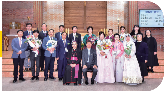
▲ 금암성당 견진성사 10월 20일(주일)