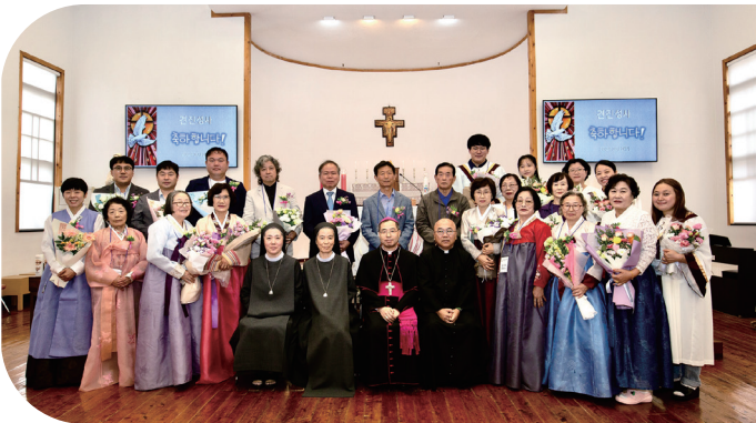
▲ 장계성당 견진성사 10월 13일(주일)