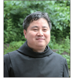
강석진 요셉 신부 (개갑장터 순교성지)

땅, 감옥에서 순교합니다. 그런데 이경언이 옥살이를 할 때 고산(진안) 지역 활목 출신으로 천주교인이라는 이유로 전주 감영으로 끌려와 함께 옥에 갇힌 윤영득이라는 소년이 있었습니다.