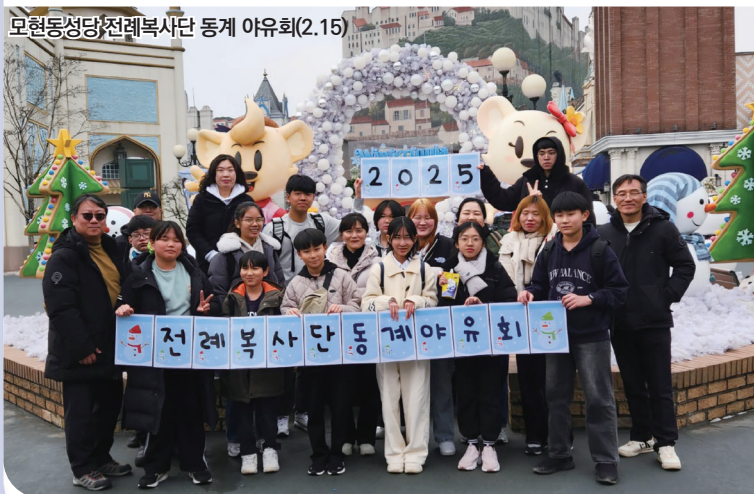
모현동성당 전례복사단 동계 야유회(2.15)