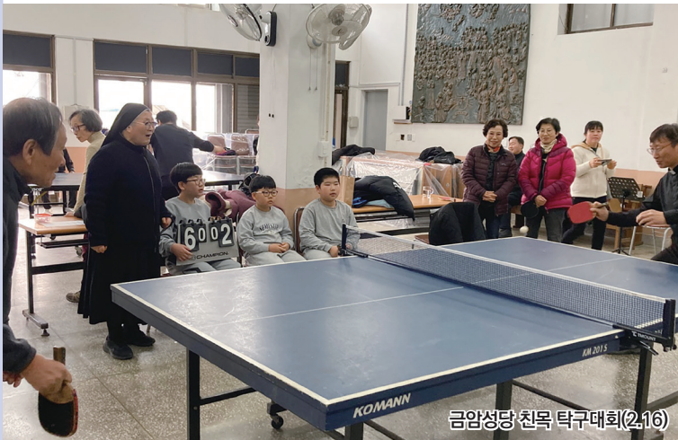
금암성당 친목 탁구대회(2.16)