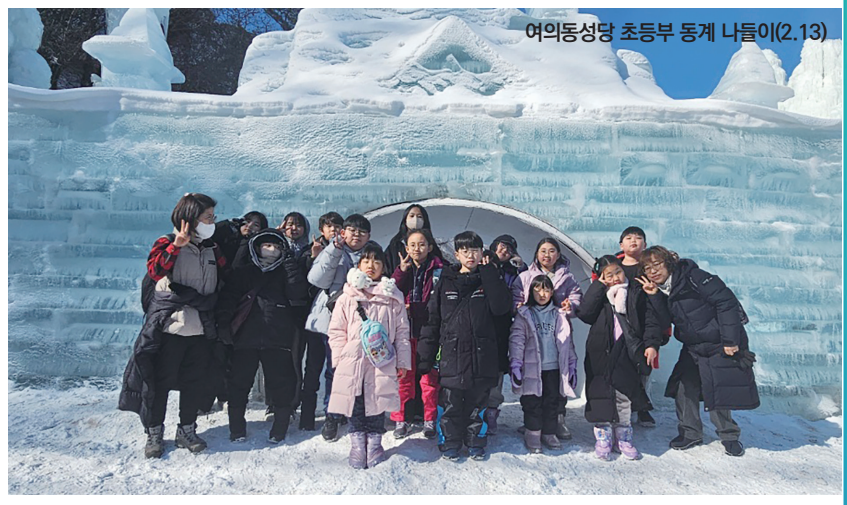
여의동성당 초등부 동계 나들이(2.13)