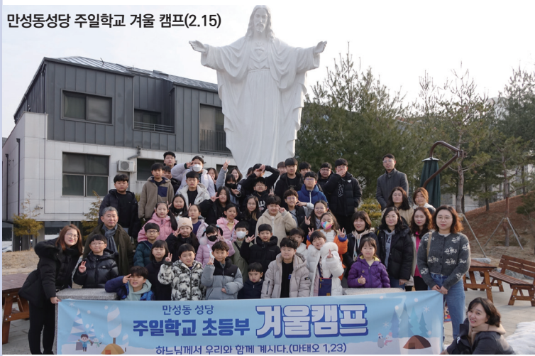
만성동성당 주일학교 겨울 캠프(2.15)