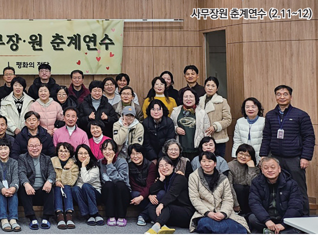
사무장·원 춘계연수 (2.11~12)