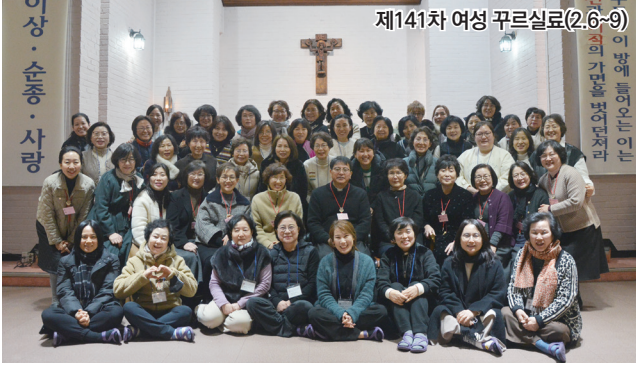
제141차 여성 꾸르실료(2.6~9)