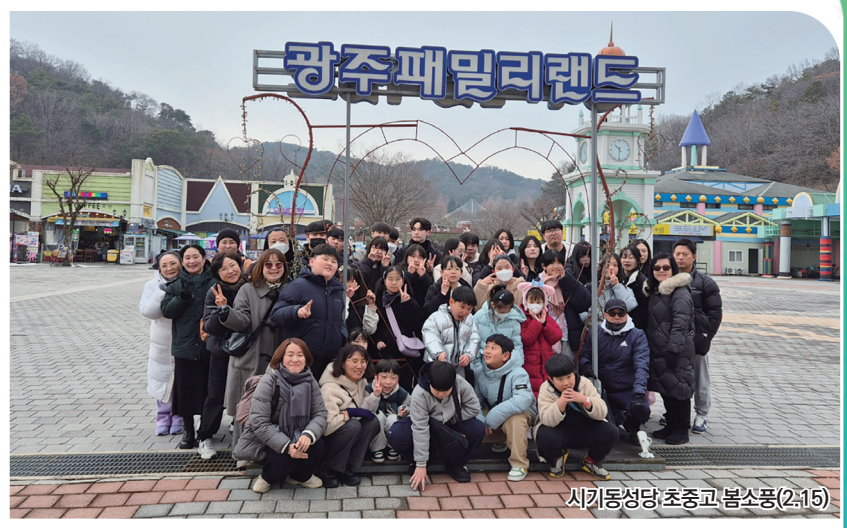
시키통성당 초중고 봄소풍(2-15)