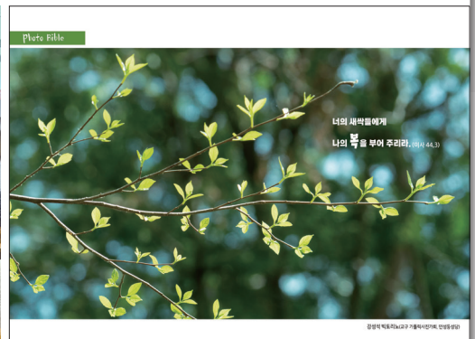
▲ Photo bible