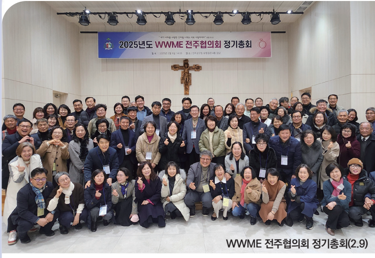
WWME 전주협의회 정기총회(2.9)