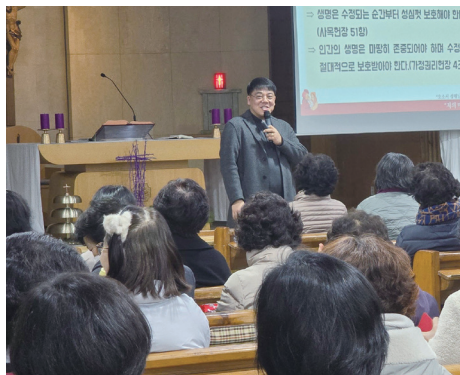
▲ 특집-2025 생명 아카데미