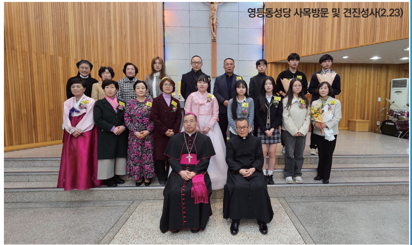
영등동성당 사목방문 및 건진성사(2.23)