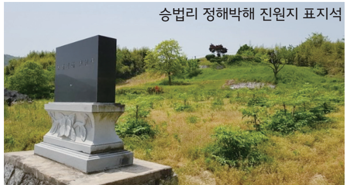
승법리 정해박해 진원지 표지석

1827년에 발생한 정해박해는 덕실마을에서 시작되었다. 덕실마을은 현재 정해박해 진원지 표지석이 있는 곳에서 서쪽으로 작은 고개를 넘은 덕동마을로 추정된다. 하지만 이 일대는 퇴적구릉을 중심으로 한 마을처럼 여겨지는 곳이다. 지형적으로 섬진강 본류와 여러 지류가 모인 곳, 그리고 압록지방의 협곡으로 인해 좋은 흙이 많이 쌓이는 곳인데, 이 구릉도 그렇게 형성되었다. 또한 주변에 산이 많아 땀감을 구하기 용이하고 섬진강 본류와 가까워 유통에 용이한 이점을 지니고 있다. 때문에 옹기 생산이 활발했던 것으로 보인다.