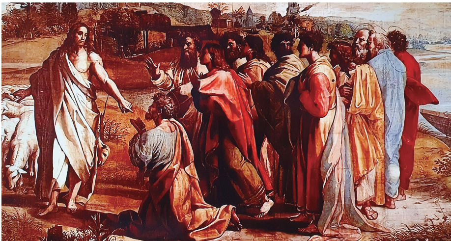
제자들을 파견하시며, “내 양들을 먹여라”(라파엘로 작, 1517~19)

우리는 성모님을 믿음의 모범이라 부릅니다. 하느님에 대한 성모님의 믿음으로 예수님께서 이 세상에 오시게 되었습니다.