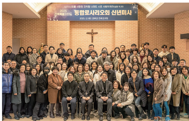
▲ 2025 통합로사리오회 신년 미사 2월 1일(토) 교구청