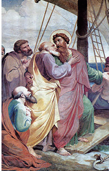
성 바오로 대성당(내부) 프레스코화

에페소는 로마제국의 속주였던 아시아 지역의 수도이자 거대한 상업 도시로서 사치와 향락이 만연하고 그리스 신화 속 아르테미스 여신을 열성적으로 숭배하던, 복음을 선포하기에 결코 만만치 않은 도시였습니다. 그러나 바오로는 유대인들과