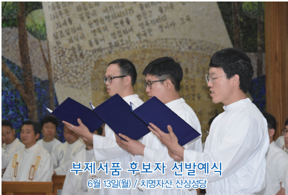
부제서품 후보자 선발예식 6월 13일(월) / 치명자산 산상성당