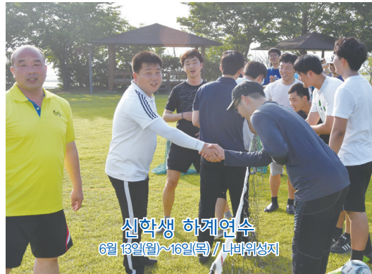
신학생 하계연수 6월 13일(월)~16일(목) / 나비위성지