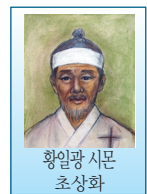
황일광 시몬 초상화

들것에 실려 가면서 / 모진 형벌에 다리가 부러져 들것에 실려 형장인 고향 홍주로 압송되면서도 황일광은 명량한 성격을 잃지 않았다.