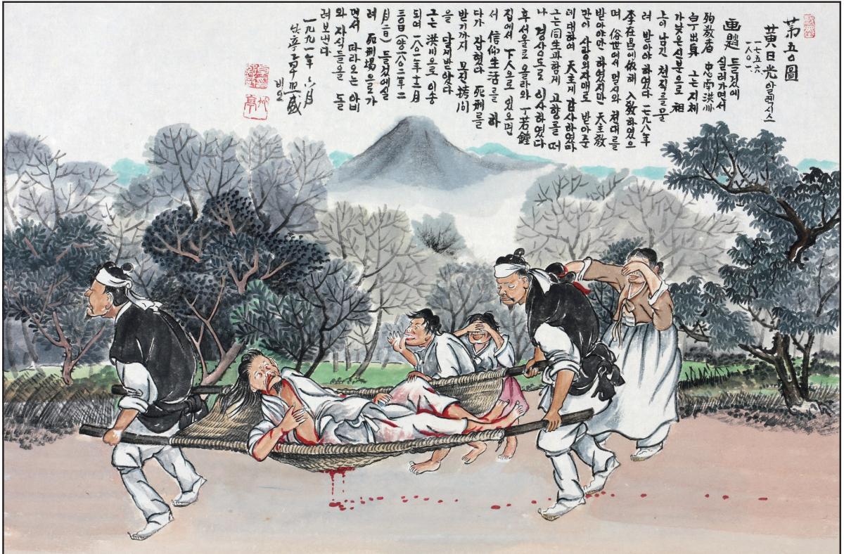
복자 124위 열전 - 황일광 시몬(1757~1802)

발행인 | 이병호 편집 | 천주교 전주교구 홍보국 제2212호 http://catholic.or.kr E-mail | catholic14@hanmail.net 주소 | 560-110 전주시 완산구 기린대로 100 전화 | (063)230-1004 팩스 | (063)230-1175