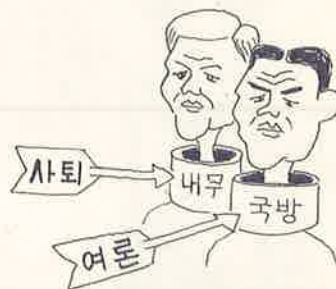
목에 침갈을 두른 나라들...