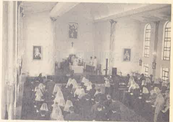
평양의 장충성당에서 미사를 드리고 있는 북한신자들

우리 교회가 몸담고 있는 한반도의 현실은 이념과 체제의 차이로 분열된 20세기의 모습을 상징하고 있습니다. 이제 우리를 제외한 온 인류사회는 이념과 체제의 장벽을