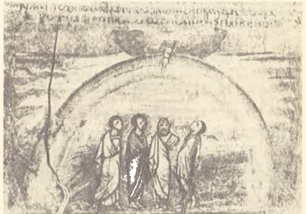
구름 사이에 무지개가 선 모습

이어지는 노아와 세 아들들의 이야기는 홍수 이후 인류의 축보를 말하고, 이 이야기는 성조사기에 있어서 핵심적