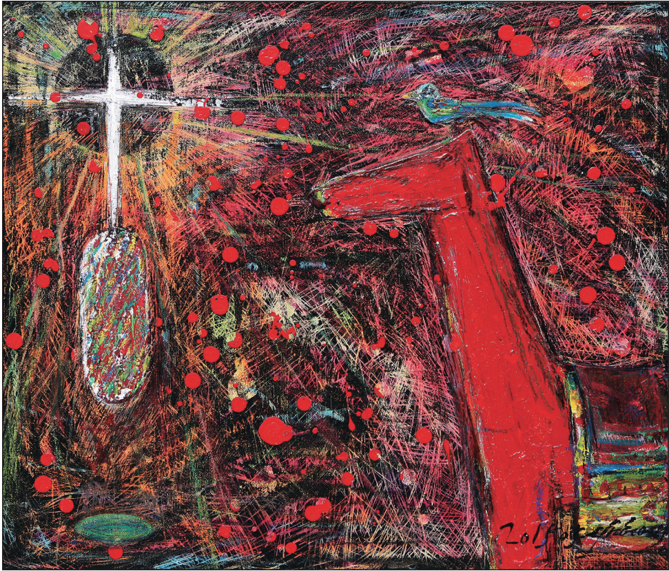
심홍재 디모레오작(전주가톨릭미술가회·소양 성당)

2015년 교구장 사목교서 - 너희의 이름이 하늘에 기록된 것을 기뻐하여라