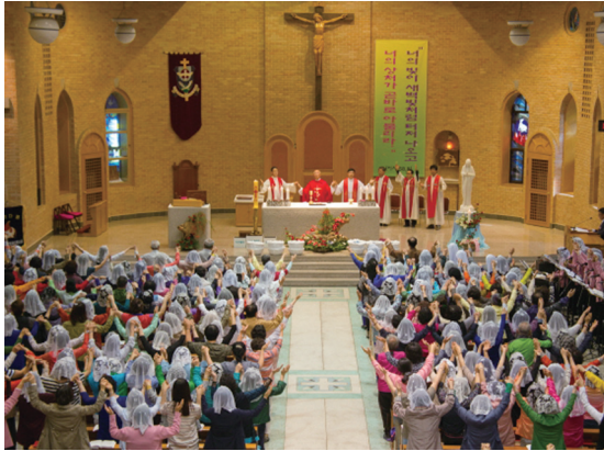
전주교구 성령대회 5월 18일(월) 중앙 성당에서 “너의 빛이 새벽빛처럼 터져나오고 너의 상처가 곧바로 아물리라.”(이사 58,8)라는 주제로 전주교구 성령대회를 열었다.