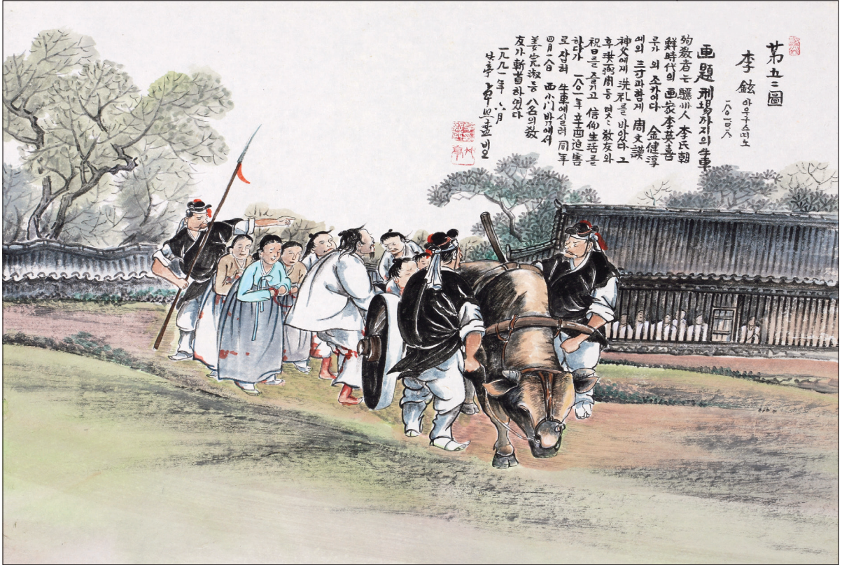
하느님의 종 124위 열전(39) -이현 안토니오(?~1801년)