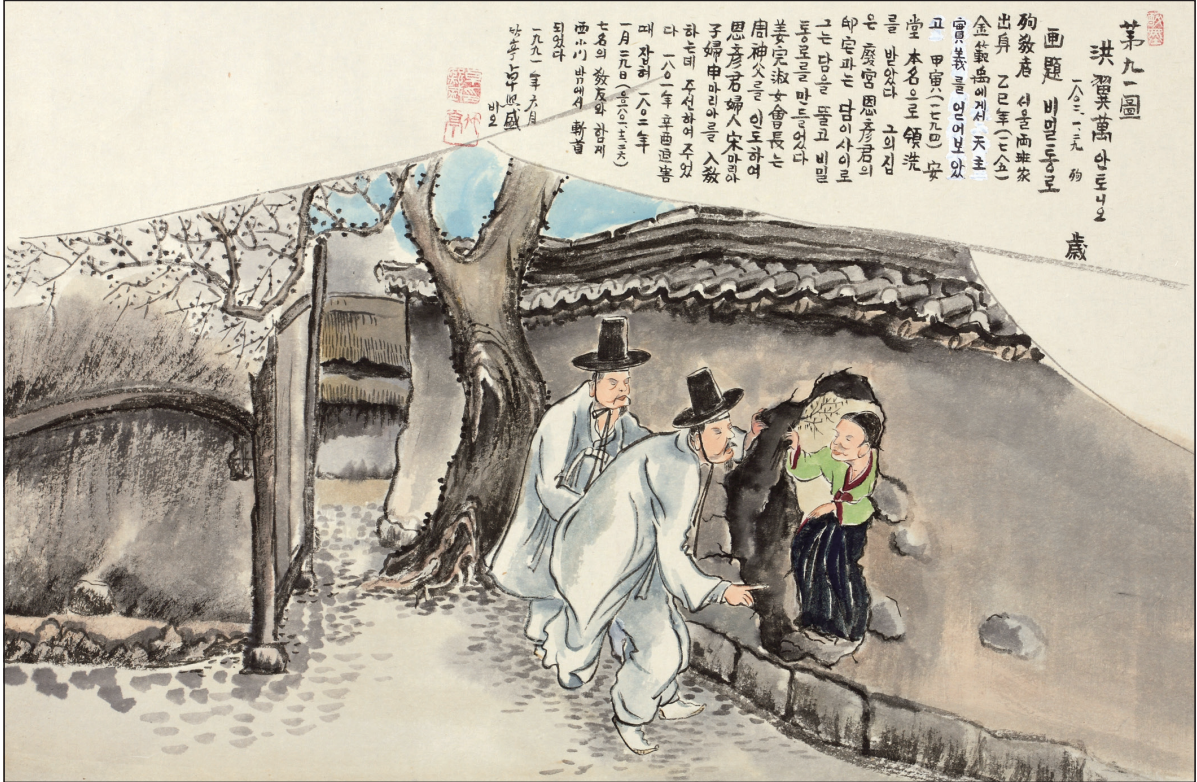
복자 124위 열전 - 홍익만 안토니오(?~1802)

발행인 | 이병호 편집 | 천주교 전주교구 홍보국 제2210호 http://catholic.or.kr E-mail | catholic14@hanmail.net 주소 | 560-110 전주시 완산구 기린대로 100 전화 | (063)230-1004 팩스 | (063)230-1175