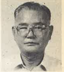
이 갑진(세자 요한) / 복자 성당

늦가을의 하늘은 높고 청아하며 들녘의 황금빛 벼이 삭은 제 뭉을 다한 듯 다소곳이 고개 숙이고 하늘에 감사드리고 있다. 겨울을 준비하는 늦가을, 자연도 새생명으로 태어나기 위해 잠시 육신의 낡은 옷을 벗는다. 새봄에 부활하기 위해. 인간도 역시 새생명으로 부활하기 위해서는 이 세상의 육신의 옷을 벗어버리는 '죽음'을 통과해야만 한다. 이 죽음은 때때로 인간을 나약과 두려움으로 초대하곤 한다.