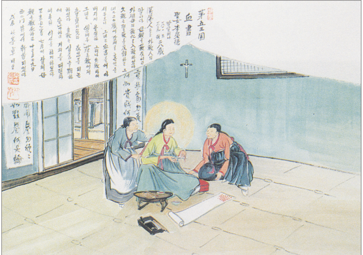
그림 | 탁희성 비오·글 | 김옥희 만나 수녀

발행인 | 이병호 편집 | 천주교 전주교구 홍보국 제 2108호 http://j catholic.or.kr E-mail | catholic114@hanmail.net 주소 | 560-110 전주시 완산구 기린대로 100번지 전화 | (063)230-1004 팩스 | (063)230-1175