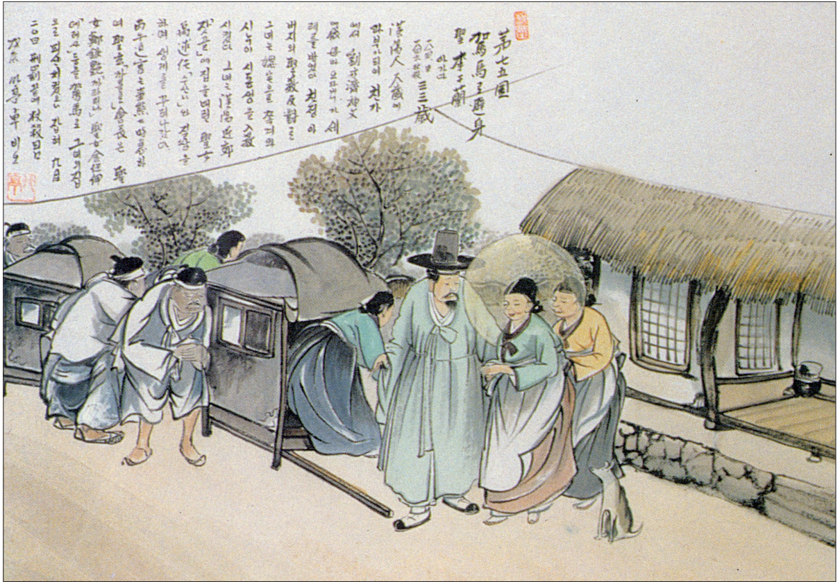
그림 | 탁희성 비오·글 | 김옥희 안나 수녀

발행인 | 이병호 편집 | 전주교 전주교구 홍보국 제2127호 http://j catholic.or.kr E-mail | catholic114@hanmail.net 주소 | 560-110 전주시 완산구 기린대로 100번지 전화 | (063)230-1004 팩스 | (063)230-1175