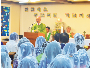
빈첸시오의 집 주보축일 미사