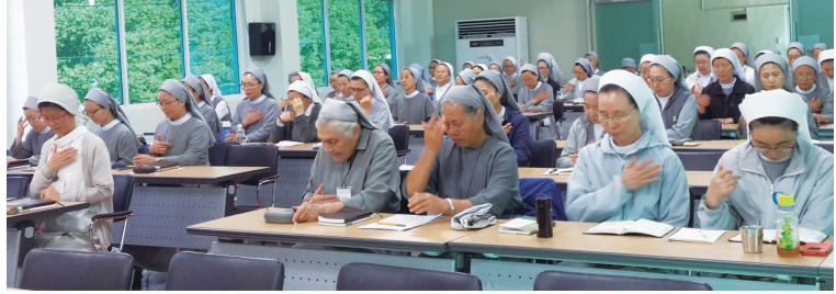
교구 수녀연합회 피정 및 총회

9월 7일(월)-9일(수) 지리산 피아골 피정의 집