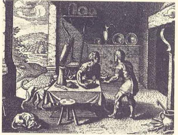
팔죽으로 장자권을 팔아 넘기는 모습

저자는 두 아이의 이름을 소개하는데 에사오는 살결이 붉고 털이 많다고 소개한다. 살결이 붉다는 것은 히브리어로 ‘붉다’는 뜻의 아돔이라는 형용사와 연관이 있다. 에돔은 붉은 땅이라는 뜻이다. 에사오는 살결이 붉고 에사오에게서 탄생된 에돔족은 붉은 땅을 차지하고 살았다는 것이다. 그리고 털투성이라는 말은 히브리말로