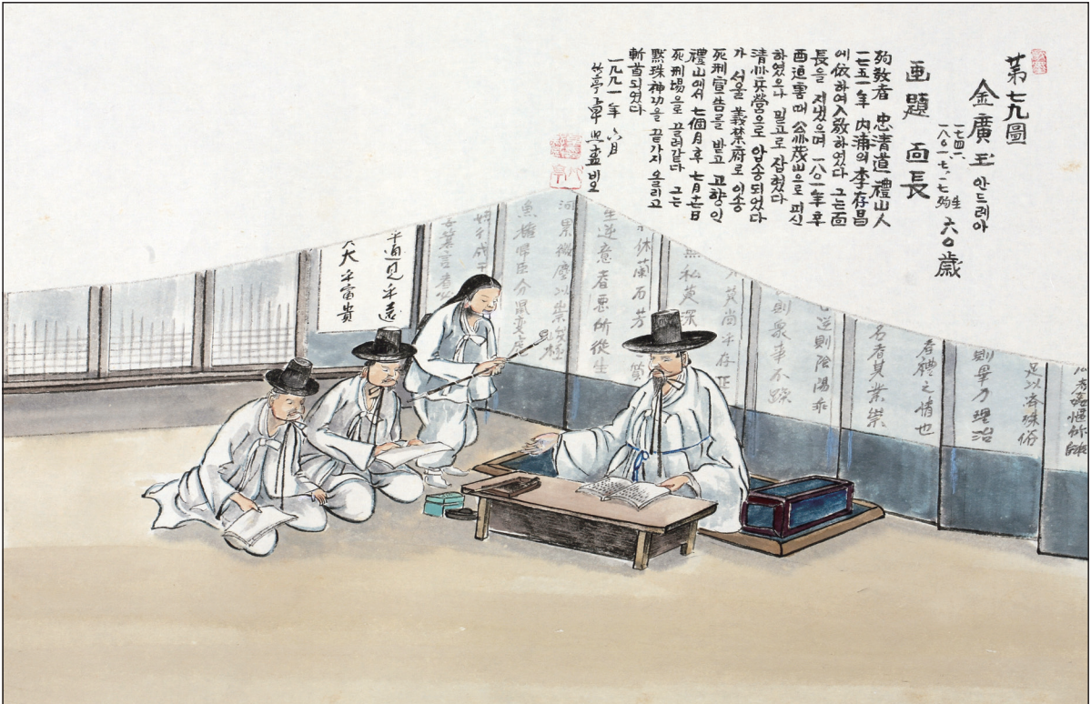
하느님의 종 124위 열전(46) - 김광옥 안드레아(1741?~1801년)

발행인 | 이병호 편집 | 천주교 전주교구 홍보국 제2192호 http://catholic.or.kr E-mail | catholic14@hanmail.net 주소 | 560-110 전주시 완산구 기린대로 100 전화 | (063)230-1004 팩스 | (063)230-1175