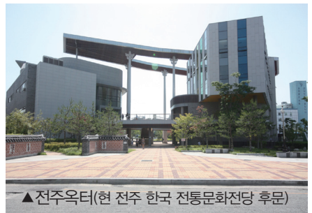
▲전주옥터(현 전주 한국 전통문화전당 후문)

-전주 옥터 : 한국 천주교회는 창설 이후 100여 년간 크고 작은 박해를 겪었는데, 전라도의 수부였던 전주에서도 박해 때마다 감옥은 천주교 신자들로 가득 찼으며, 혹독한 문초와 형벌을 받고 신앙을 증거하며 순교했다. 1801년 신유박해 때 동정부부인 유중철 요한과 그의 동생 유문석 요한이 그해 10월 9일 옥중 교살되었으며, 1829년 정해박해 때는 240여 명이 넘는 천주교인들이 감금되어 문초를 받았다. 이때 이순이 루갈다의 동생 이경언 바오로도 이곳에서 옥사했다. 1839년 기해박해 때 순교한 이들 중에는 1827년 정해박해 때 잡혀와 만 12년간의 긴긴 세월을 옥중에서 보낸 이들도 있다. 이들에게 있어 옥은 고통스런 고난처이었지만 동시에 기도처였다. 옥중에서도 밤마다 등불을 켜놓고 함께 성경을 읽으며 큰소리로 기도를 드렸다고 한다. 가장 어렵고 힘든 삶의 자리가 신앙인에게는 곧 기도처가 될 수 있음을 다시금 의식하게 한다.