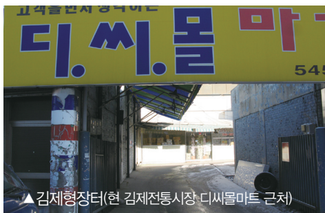
▲김제형장터(현 김제전통시장 디씨몰마트 근처)

-김제 동헌과 형장터(한정흠 스타니슬라오 순교터) : 전라도 김제의 가난한 양반 집안에서 태어난 한정흠 스타니슬라오는 먼 친척인 유향점으로부터 교리를 배워 입교하였고, 주문모 야고보 신부가 전주를 방문했을 때 세례성사를 받았다. 그는 교회의 가르침에 따라 유교식 제사를 폐지하기도 했다. 1801년 3월 신유박해 때 체포되어 전주감영으로 끌려가 혹독한 문초와 형벌을 받았으나 조금도 굴복하지 않았다. 이곳에서 열심한 신자인 김천애 안드레아와 최여겸 마티아를 동료로 맞이하게 되었다. 한정흠과 동료들은 한양으로 압송되어 문초를 받았다. 한정흠은 고향인 김제로 이송되어 옥에 갇혀 있다가 며칠 후인 1801년 8월 26일에 장터에서 참수